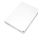
Faltpapierblock 110x150x45mm Artikel-Nr. CP 110