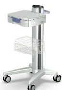
Gerätewagen EPRO Mit Schublade, Korb, Doppellenkrollen Artikel-Nr. EPRO