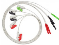
Elektrodenleitungen 61cm mit 5 Clips Artikel-Nr. ELDW-5