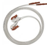
Elektrodenleitung braun 152cm mit Clip für EMG Artikel-Nr. ELDW-2