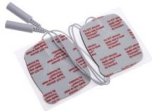
Thymatron EKT-Behandlungselektroden Artikel-Nr. EPAD-C