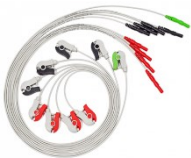
Elektrodenleitungen 61cm mit 9 Clips Artikel-Nr. ELDW-9