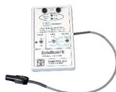
Ectobrain II EKT-Simulator und Tester Artikel-Nr. ECTOB