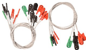
Elektrodenleitungen 61cm mit 5 oder 9 Clips Artikel-Nr. ELDSC-5 /ELDSC-9