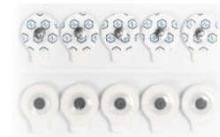
Solid Gel Klebeelektroden für EEG/EKG/EMG, 32x25mm Artikel-Nr. EEDS-SG/C